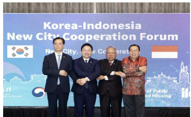
< 한국해외인프라도시개발공사 - 인니 국영금융공사 간 인프라/도시 개발 사업 금융 협력 MOU 체결 >