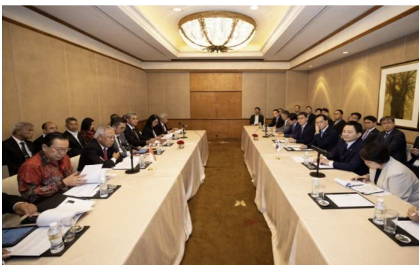
< 16일, 제1회 한-인니 New City 협력포럼 >