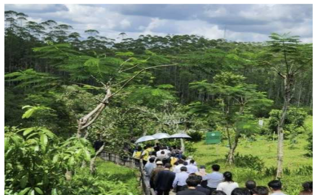
< 인도네시아 신수도 개발원점으로 향하는 길 >