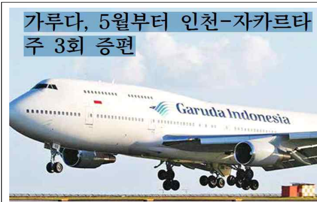
< 가루다 인도네시아 항공기 >