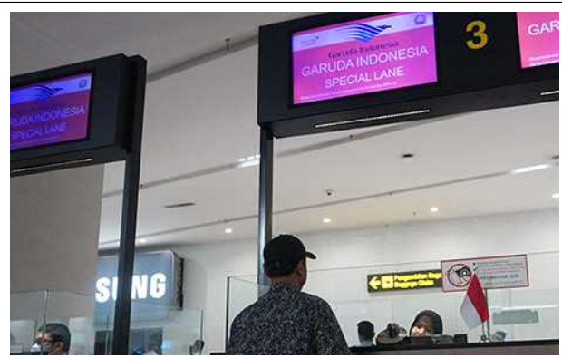
< 가루다 인도네시아 항공 입국 전용 라인 >