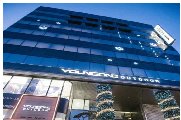
<영원무역 인도 자회사>